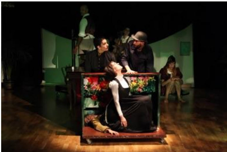
FOTO es una obra de teatro de medio formato altamente visual y con un espacio sonoro en vivo. FOTO abre la puerta del antiguo casón de una familia burguesa de finales del siglo XIX. Las paredes hablan, y los sirvientes susurran sobre los amos en una casa donde los secretos llevan demasiado tiempo enterrados.

Para más información y para ver videos de todas estas obras visitar: